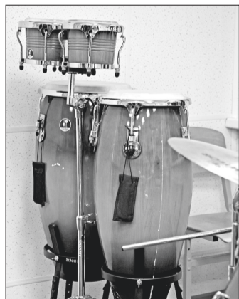
В рамках нацпроекта «Культура» переоснащены музыкальными инструментами и современным оборудованием две школы искусств.